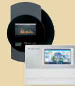
Solar-Log™ Meteocontrol WEB'log Akcesoria