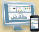
Portal StecaGrid Portal sieci Web